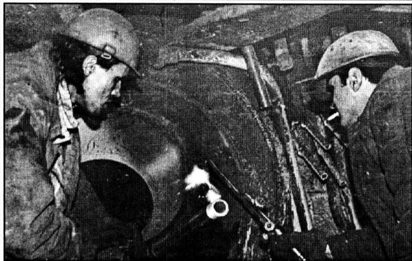
Идут сварочные работы.