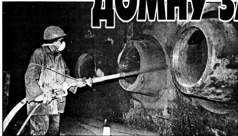
Подготовка домны к кладке кирпича.