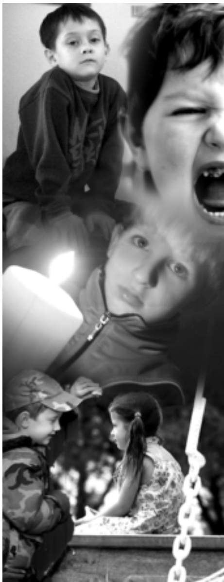
КОЛАЖ ИРИНЫ ЖУРАВЛЕВОЙ