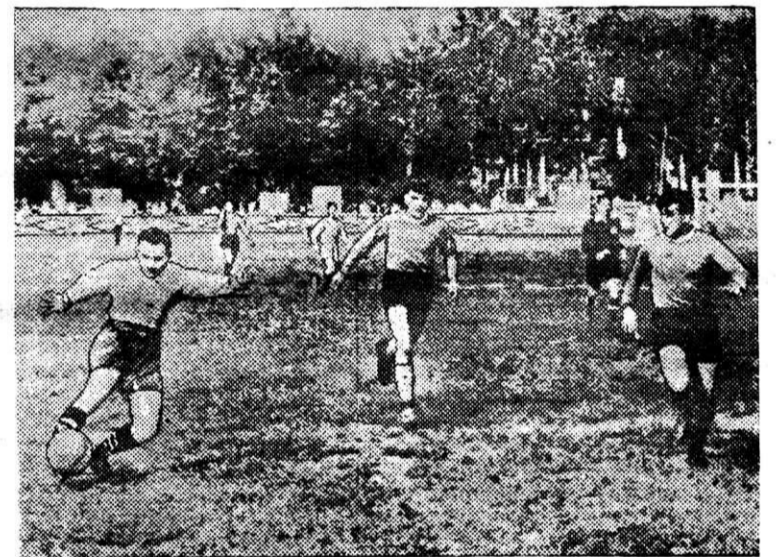
На снимках (вверху): капитаны футбольных команд поднимают флаг соревнований. Внизу: момент игры между командами Магнитогорска и Красноярска.