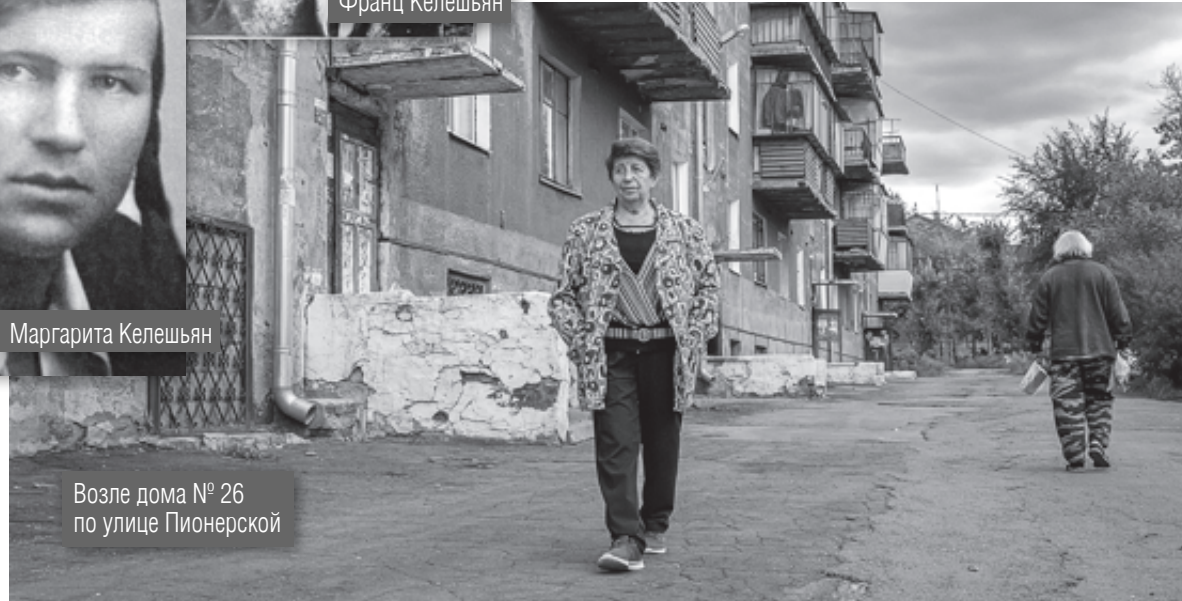
Возле дома № 26 по улице Пионерской