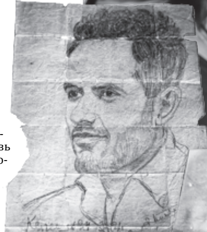
Портрет, нарисованный в тюрьме неизвестным художником