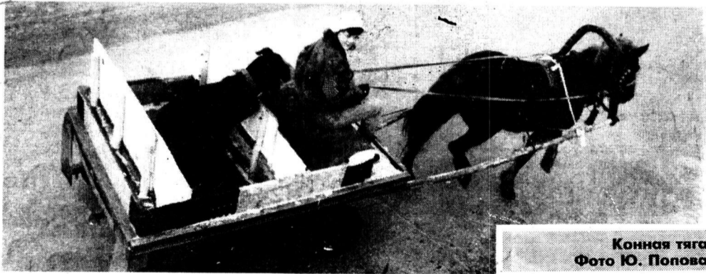
Конная тяга.

Женщину пришлось срочно отправить в больницу. Только там врачам с превеликим трудом удалось высвободить правую руку. По словам коллег, сейчас жертва унитаза чувствует себя хорошо.