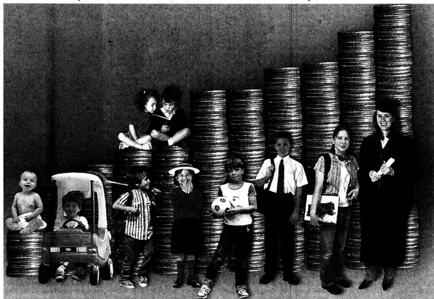
На пенсионные пилюли надо откладывать деньги сызмательства.