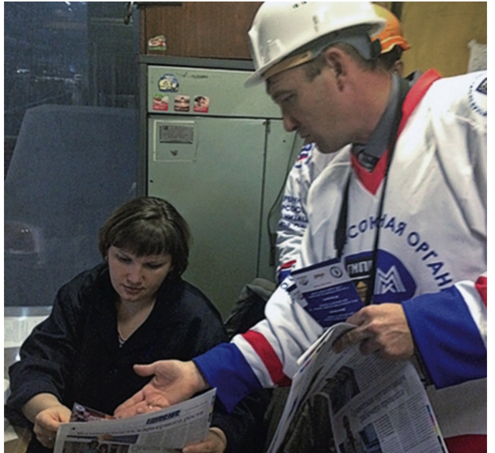
Активисты раздают в цехах ОАО «ММК» спецвыпуск профсоюзной газеты «Единение», посвящённый Всемирному дню действий «За достойный труд!»