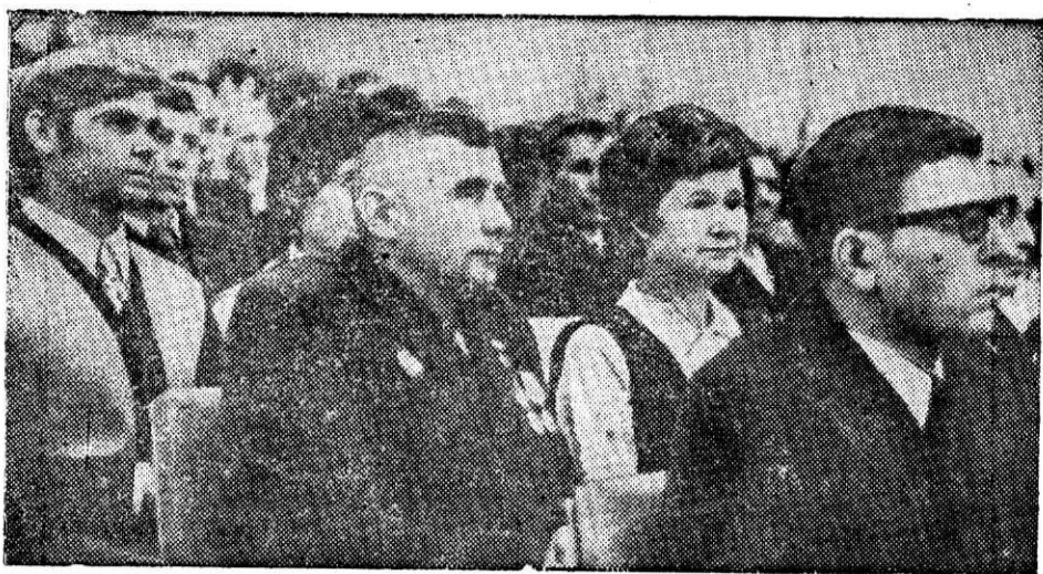
ФОТОРЕПОРТАЖ О ВРУЧЕНИИ ОБЛАСТНОЙ ПРЕМИИ ИМ. Г. И. НОСОВА