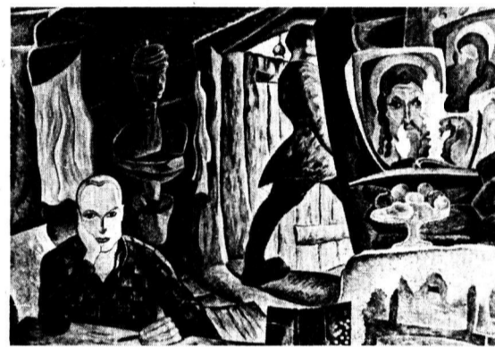
Уходящий. Худ. Владислав Аристов

Подлинная поэзия природна и провиденциальна, насилие ей противостоит, власть же, погрязшая в насилии, нуждается в декорациях, украшающих просцениум и государство, и она их нашла, и мы знали их со школьной скамьи. Поэта же, сказавшего о своем времени: «В этом мраке, в этой темноте Страшно выглянуть