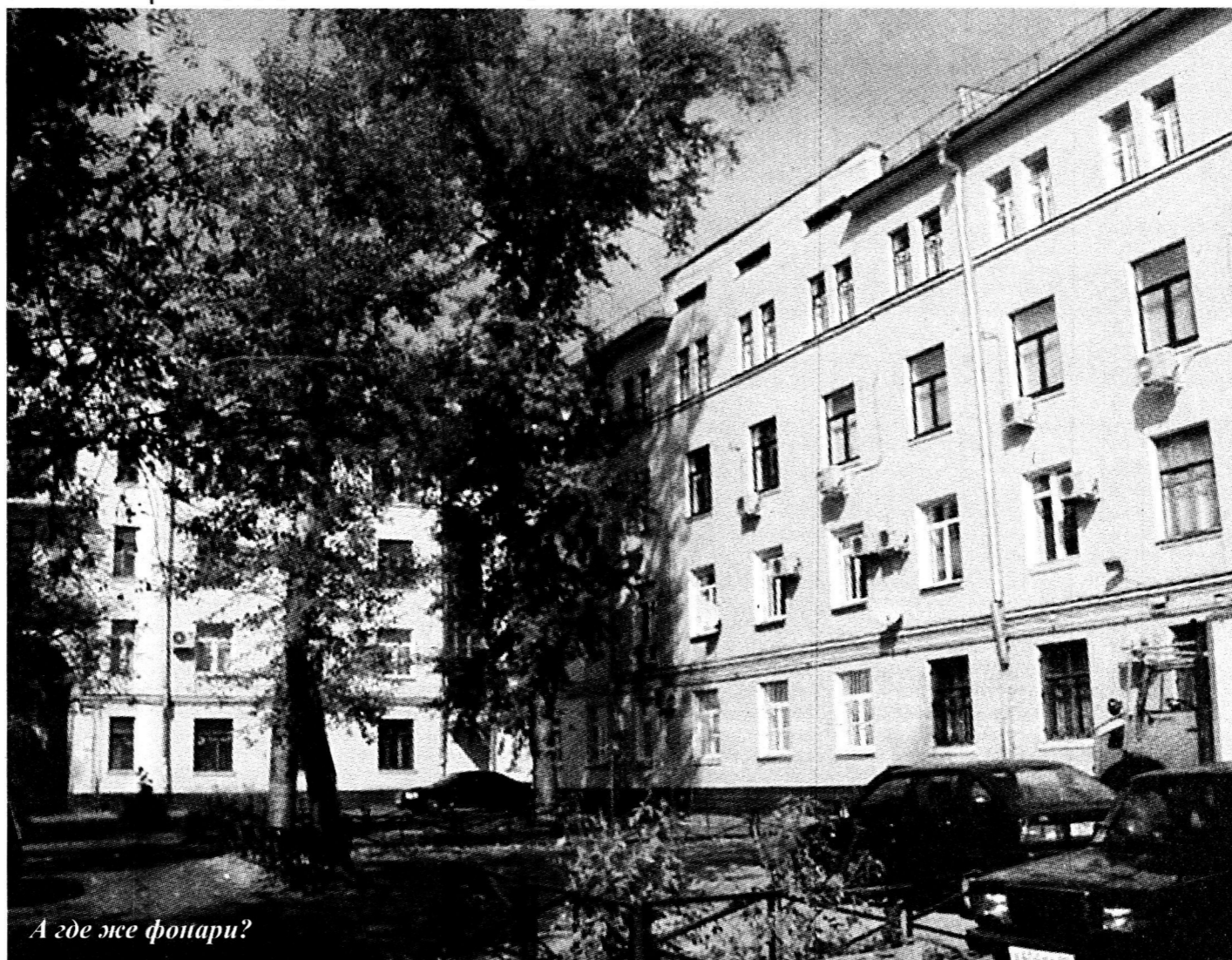
А где же фонари?

— привел веский довод позвонивший недавно в редакцию работник ММК. Свет же в «темном» дворе «царстве» призваны обеспечить так называемые в простонародье гусакки — фонарные навесы на уровне второго этажа. Ниже нельзя: хулиганы быстро все «осветят» перебьют. Именно поэтому выделенные губернатором 11 миллионов рублей будут потрачены на установку железных дверей в подъездах и оборудование внутриквартального освещения. Городская администрация совместно с коммунальными службами уже приступила к выполнению этой задачи. По результатам тендера определены фирмы, которые занимаются установкой железных дверей в подъездах и оборудованием освещения внутри дворов. Не останутся без внимания и просьбы директоров муниципальных учреждений, особенно детских садов — в некоторых из них только металлические двери могут стать надежным заслоном на пути непрошенных посетителей. Актуальный для Магнитки лозунг «Безопасность — превыше всего», таким образом, перерастает в настоящую акцию, которая, даже еще не начавшись, вызвала живой отклик у сотрудников магнитогорской милиции. — Установка железных дверей в подъездах и оборудование внутриквартального освещения — это реальная профилактическая мера против грабежей, уличных преступлений