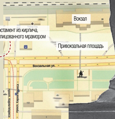
Постамент из кирпича, облицованного мрамором