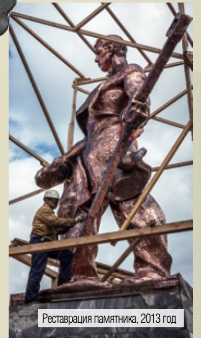
Реставрация памятника, 2013 год

В августе-сентябре 2013 года памятник был отреставрирован.