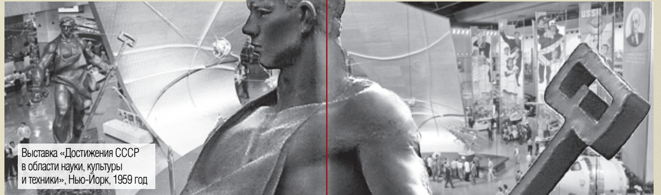
Выставка «Достижения СССР в области науки, культуры и техники», Нью-Йорк, 1959 год