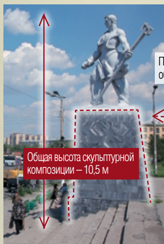
Общая высота скульптурной композиции – 10,5 м