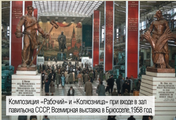
Композиция «Рабочий» и «Колхозница» при входе в зал павильона СССР, Всемирная выставка в Брюсселе, 1958 год

С 1963 года работа А. Зеленского выставлялась на ВДНХ, а по другой версии – хранилась в фондах скульптурного комбината Союза художников СССР.