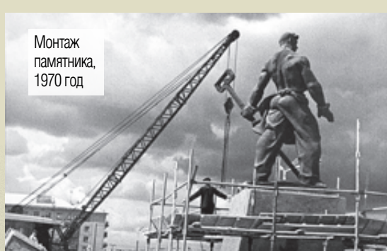
Монтаж памятника, 1970 год

Памятник на протяжении всей его «магнитогорской» истории преследуют многочисленные путаницы. Всё началось с авторства. Долгое время считалось, что скульптура изготовлена по эскизу знаменитой Веры Мухиной, создателя «Рабочего и колхозницы». По другой версии авторство принадлежало скульптору Нине Зеленской. И только в 1982 году челябинский искусствовед Виктор Титов установил, что автор памятника – московский скульптор Алексей Зеленский. Когда же имя скульптора решили увековечить на постаменте, то неверно указали инициалы. Такая же неразбериха и с названием. Зеленский изначально назвал памятник – «Рабочий», а уже горожане переименовали его в «Металлурга» и «Сталевара».