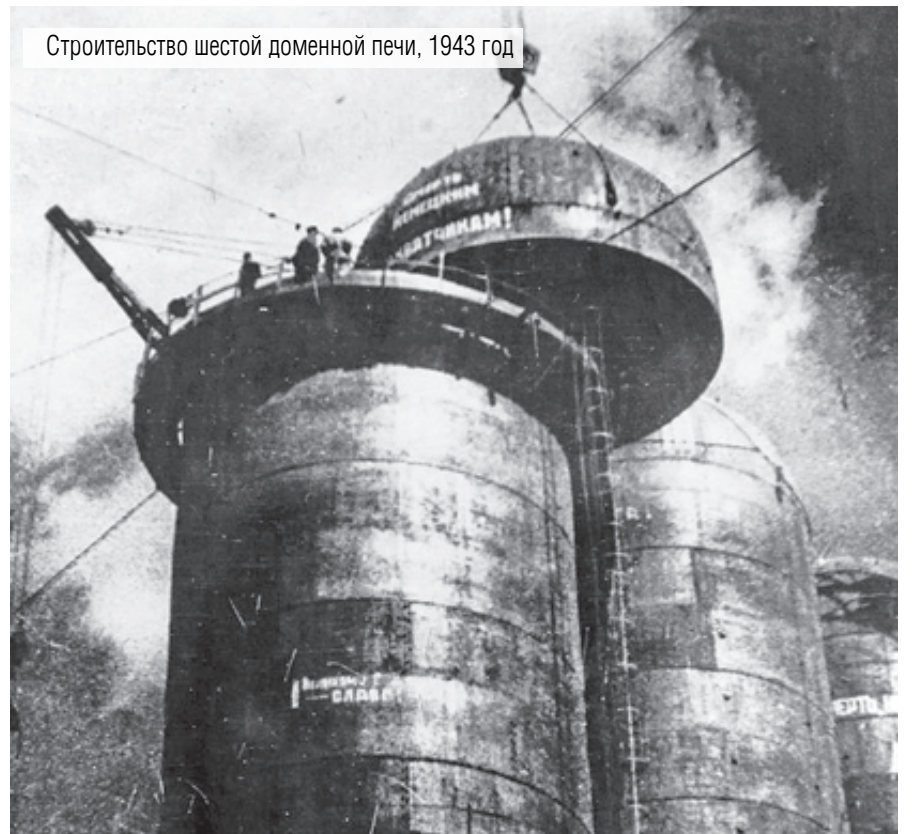
Строительство шестой доменной печи, 1943 год