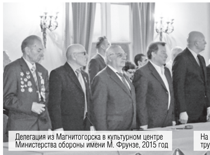
Делегация из Магнитогорска в культурном центре Министерства обороны имени М. Фрунзе, 2015 год

Почти пятнадцать лет городская общественность добивалась признания на федеральном уровне трудовых заслуг магнитогорцев в годы Великой Отечественной войны