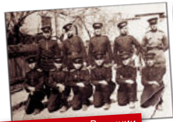
Воинская часть в Румынии

Куксин и написаны десятки научных работ и учебно-методических разработок по профилактике правонарушений и преступлений, выходявших в советских специализированных журналах. А первая статья о пагубности праздной жизни опубликована в 1959 году на страницах «Магнитогорского рабочего». В ней молодой милиционер