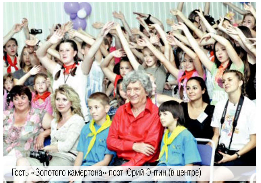
Гость «Золотого камертона» поэт Юрий Энтин (в центре)

уже в который раз приезжает в Магнитогорск, высоко отзываясь о центре и юных любителях качественного, классического джаза.