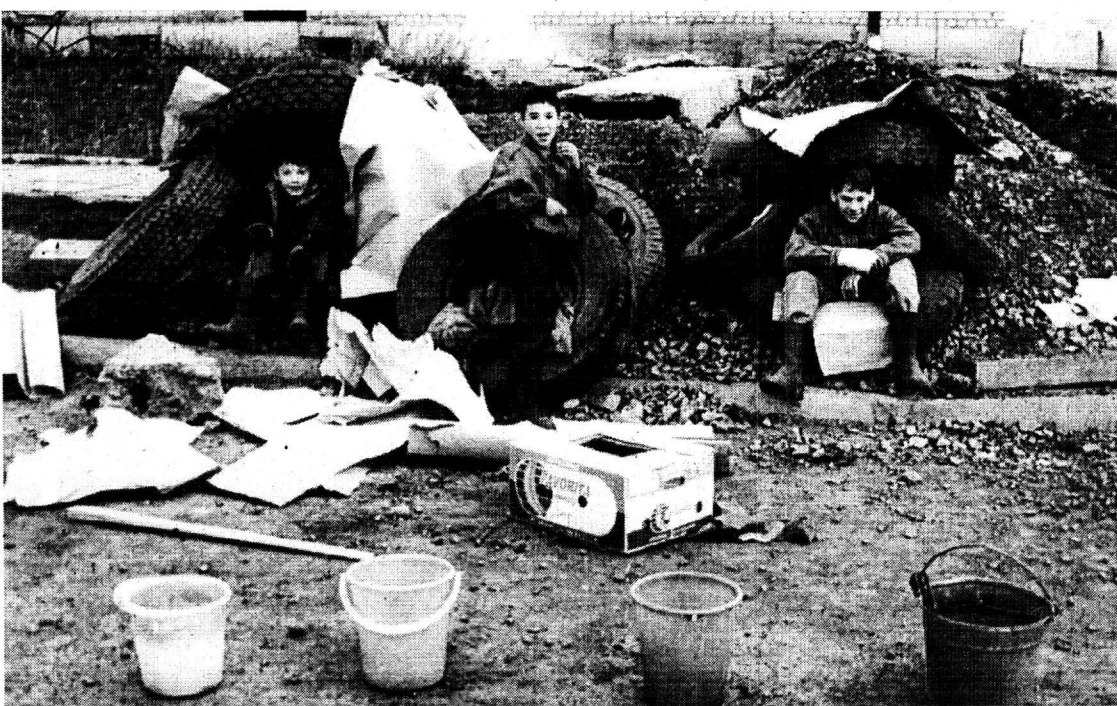
Наши дети быстрее адаптируются к условиям рынка. На снимке: мойщики машин в боевой готовности.

Сотрудники сектора переобучения благодарны руководству АТП ОАО «Магнитострой», ЗАО «МАРС» ОАО «ММК» за понимание молодежной проблемы и реаль-