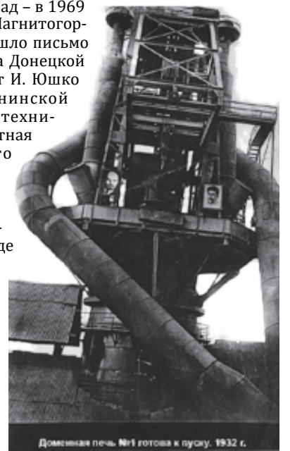
Доменная печь. №1 готова к пуску. 1932 г.

Он выяснил, что удивительный экспонат нашёл в огороде один из учащихся техникума и отдал преподавателю металлургии, а тот передал в комнату-музей. На фотоснимке, который прилагался к письму, – такая же отливка, которую сегодня можно увидеть в музее ММК: