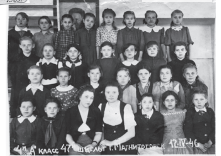
4й А класс 47 школы г. Магнитогорск 12.11.46