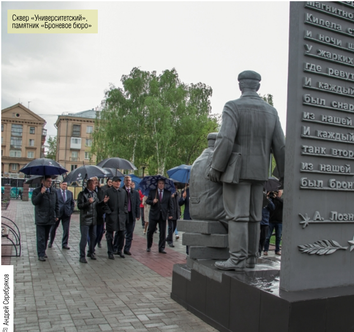
Сквер «Университетский», памятник «Броневое бюро»