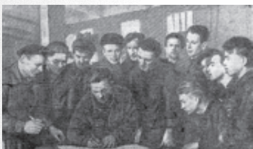
Подписание обращения Всемирного совета мира

Газета «Магнитогорский металл» сообщила о завершении кампании по сбору подписей под обращением Всемирного совета мира против подготовки атомной войны. За период кампании в СССР прошли сотни тысяч собраний. Всего под обращением поставили свои подписи 123543604 советских гражданина.