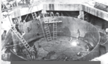
Строительство фундамента под первую домну

Произведена закладка первой домны Магнитки.