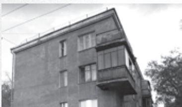
Первый капитальный дом Магнитки