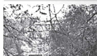
Первое здание индустриального техникума

Состоялся первый выпуск Магнитогорского индустриального техникума. Дипломы техников получили одиннадцать человек. Здание индустриального техникума, построенное в 1932 году, располагалось по адресу: улица Большевикская, 11. В послевоенные годы здесь размещалось ГПТУ № 19. Ныне здание, бывшее объектом культурного наследия регионального значения, пустует и разрушается.