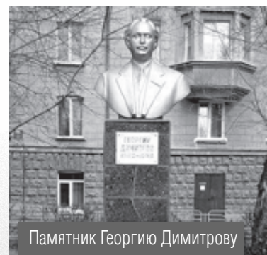
Памятник Георгию Димитрову

В сквере на углу улицы Чапаева и проспекта Металлургов состоялось открытие памятника Георгию Димитрову – вождю болгарского народа, которого называли болгарским Лениным. 15 июня 2000 года бюст Димитрова был похищен неизвестными злоумышленниками. Его обнаружили в лесопосадке, в районе пятой проходной металлургического комбината, и вернули на прежнее место. Бюст был установлен в память о пребывании на Южном Урале в 1957-1960 годах болгарских юношей и девушек, получивших в Магнитке различные рабочие профессии.