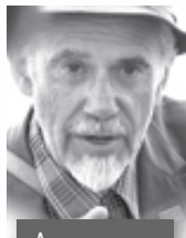
Археолог Отто Бадер