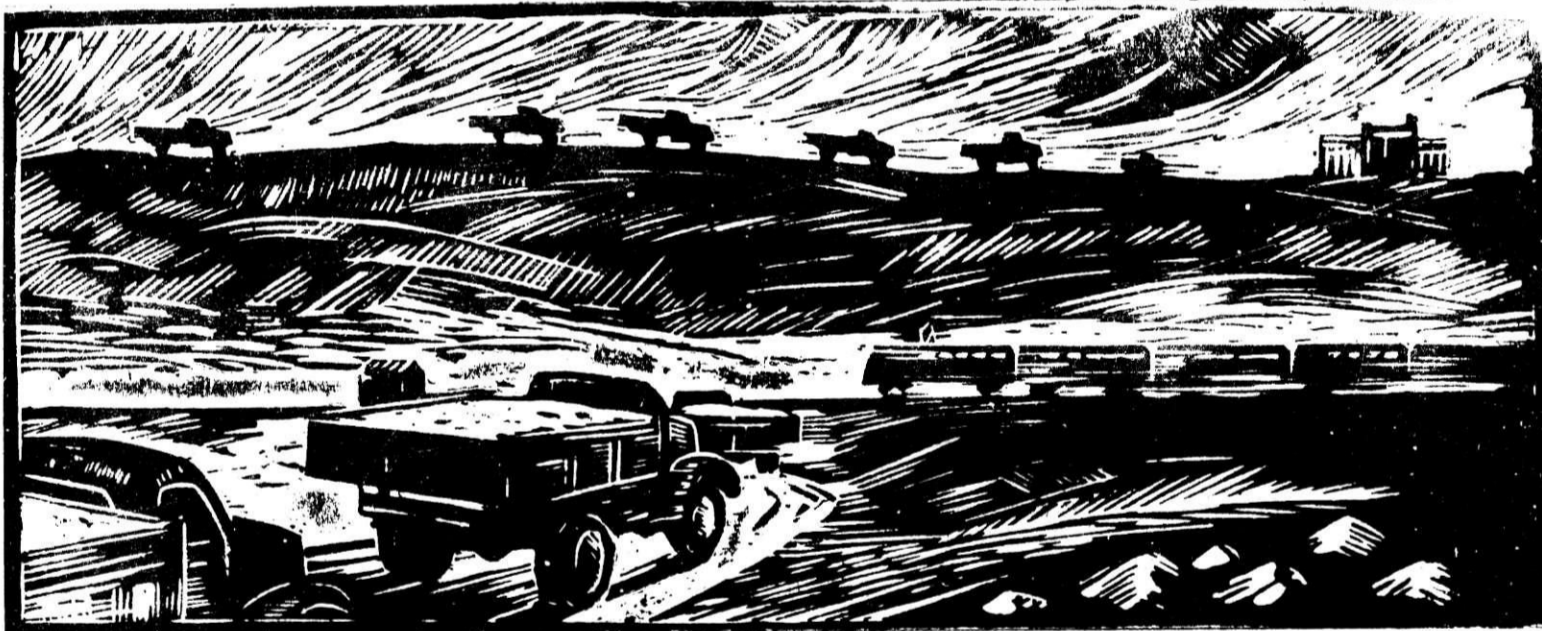
ЗДРАВСТВУЙ, УРОЖАЙ! Линогравюра П. Хныкина.

И крепнут сосны на просторе, напившись солнца и воды. Им неуступчивые горы фундамент дали из руды.