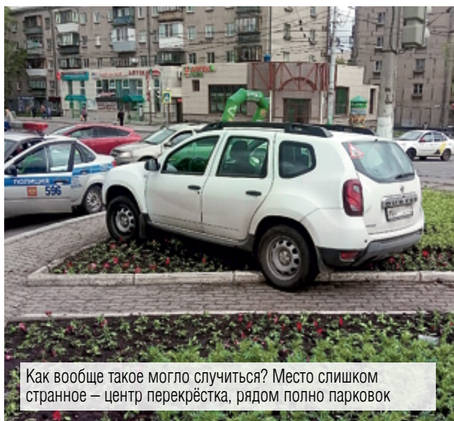
Как вообще такое могло случиться? Место слишком странное – центр перекрёстка, рядом полно парковок