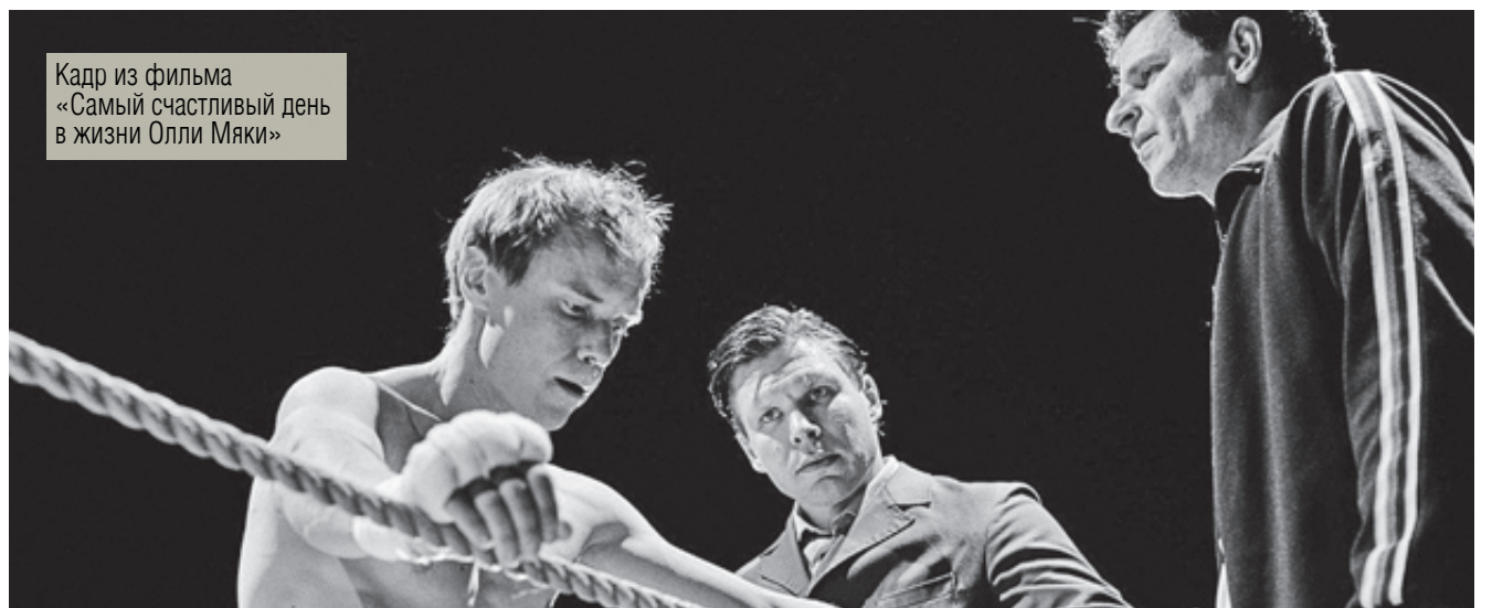
Кадр из фильма «Самый счастливый день в жизни Олли Мяки»