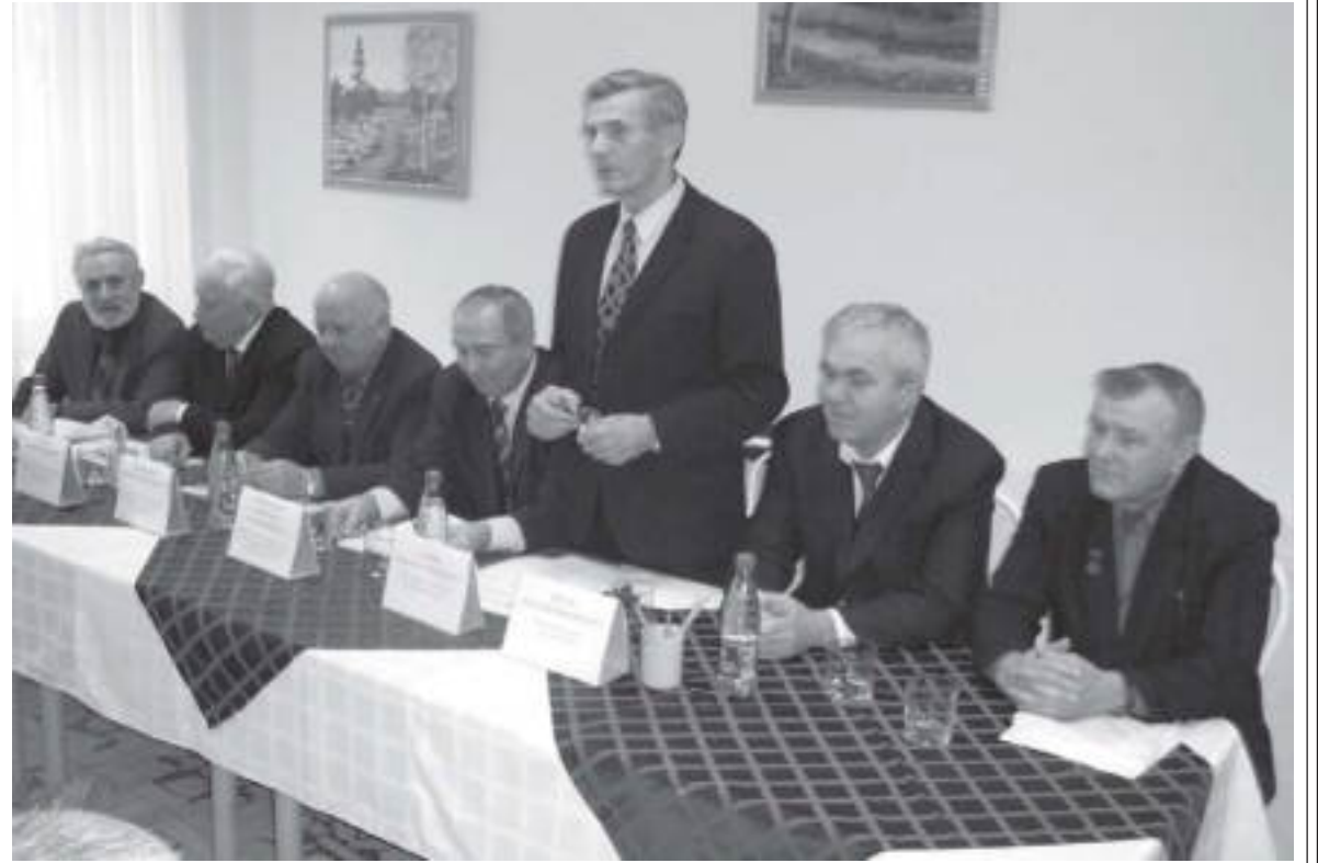
Встречи ветеранов с руководством города и комбината проходят регулярно

ГОРОДСКОЙ совет ветеранов и благотворительный фонд «Металлург» провели совещание по активизации работы советов ветеранов первичных организаций в год 40-летия ветеранского движения города и 75-летия ОАО «ММК».