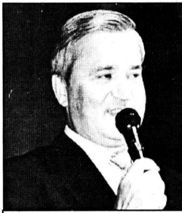
Поздравление от ММК.