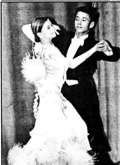
«Танцующий город» — педагогам Магнитки.