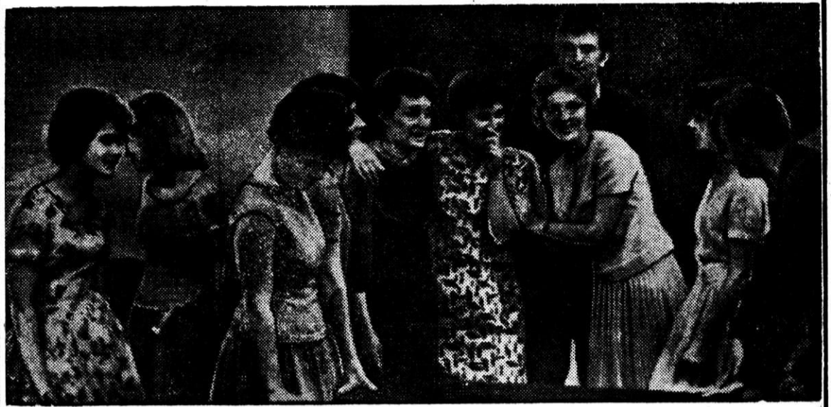
На прощальном школьном балу

Но не всегда так было. Первое время станок не слушался, резцы ломались, детали уходили в брак. А сколько насмешек при-