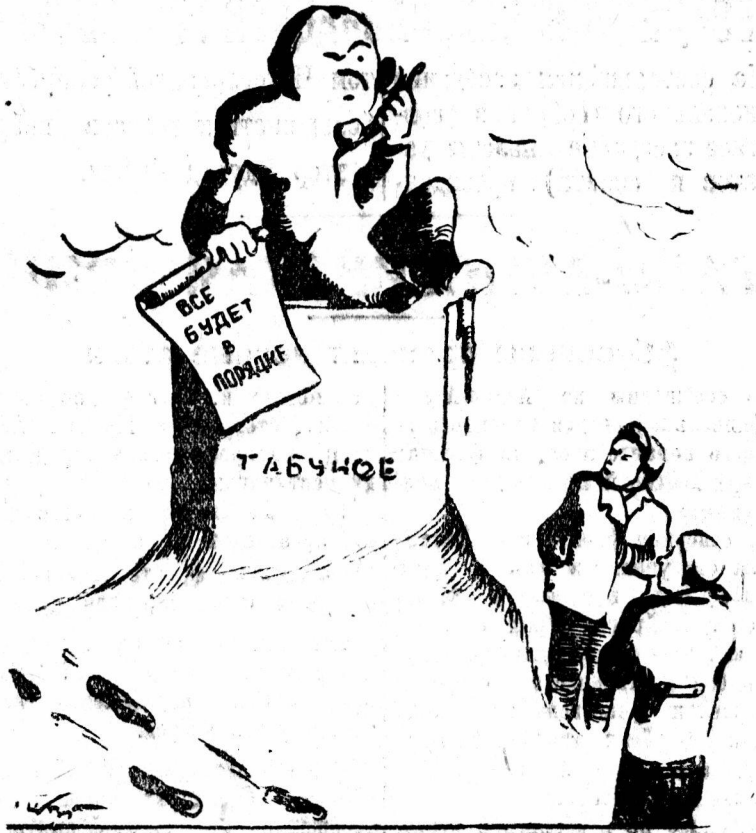
НА ВЫСОТЕ ПОЛОЖЕНИЯ