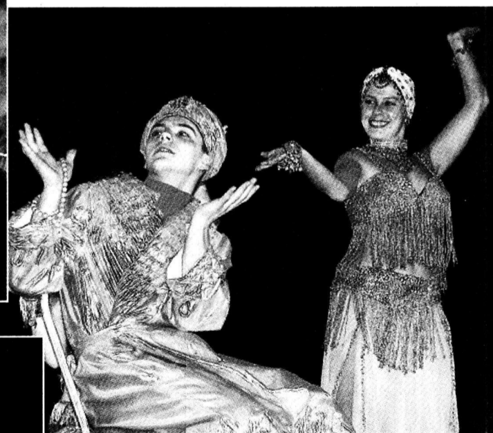
«Если б я был султан...»