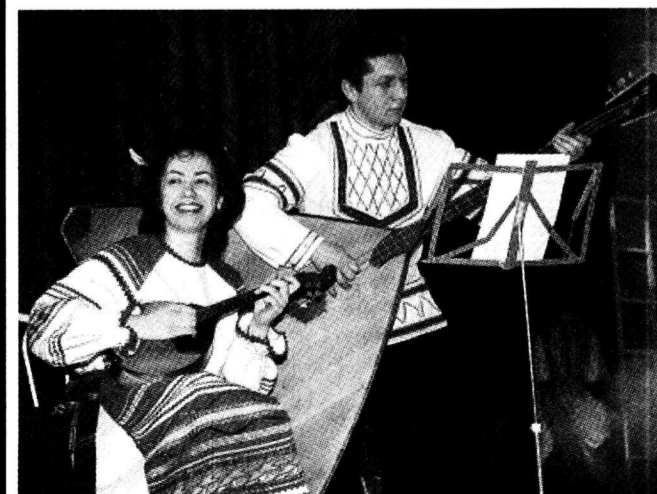
«Ах, теща моя, ласковая!»