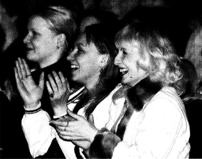
А тещины блины уже съедены.