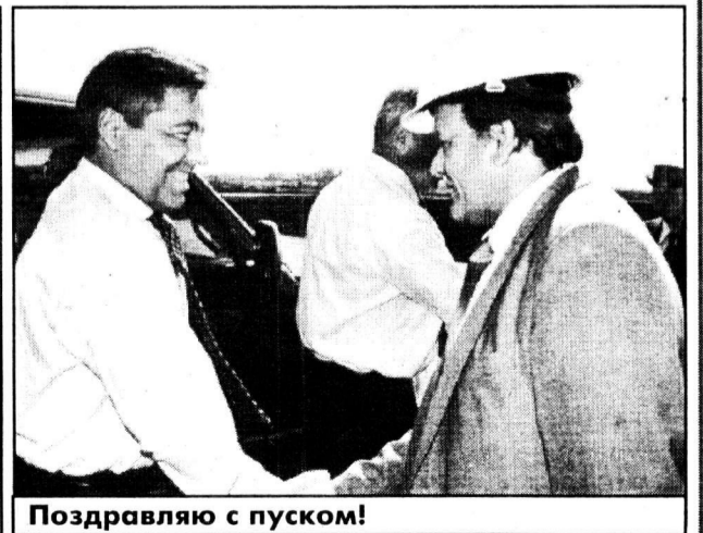
Поздравляю с пуском!