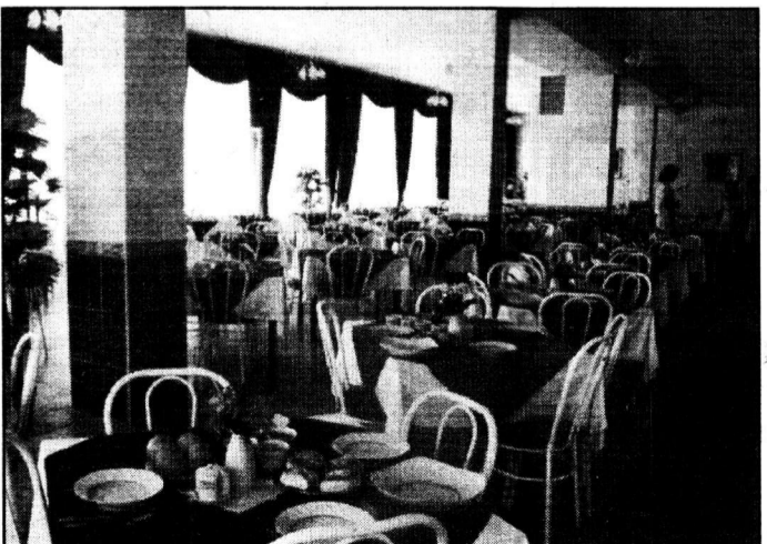
В такой столовой приятно пообедать.