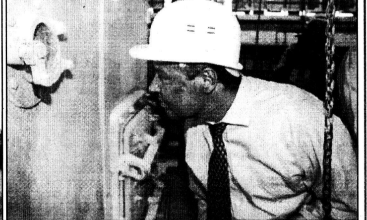
Что там, внутри печи?