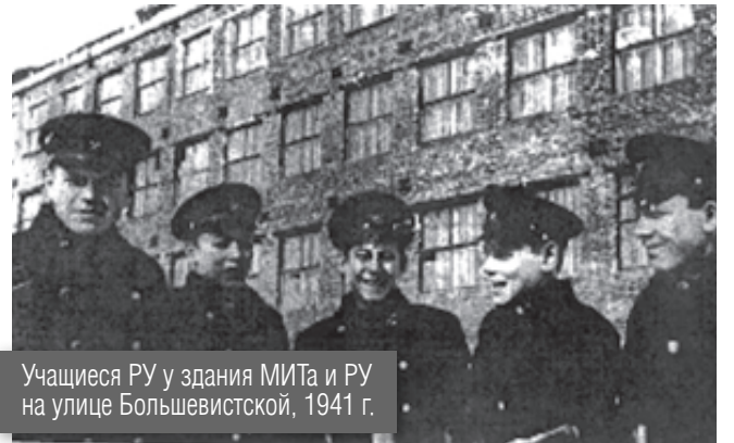
Учащиеся РУ у здания МИТа и РУ на улице Большевицкой, 1941 г.