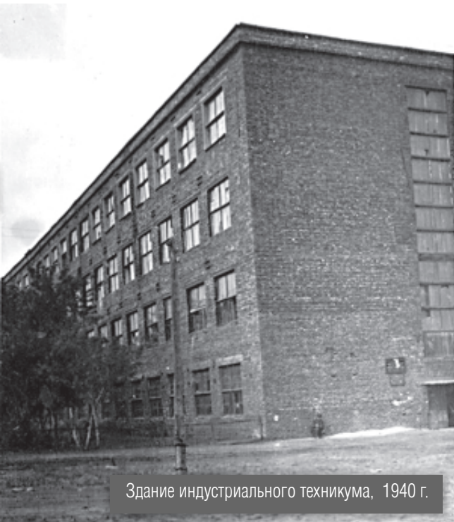
Здание индустриального техникума, 1940 г.