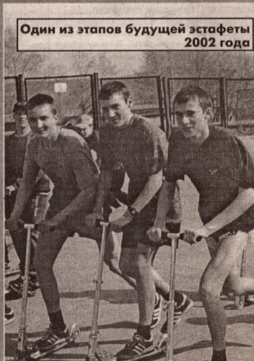
Один из этапов будущей эстафеты 2002 года