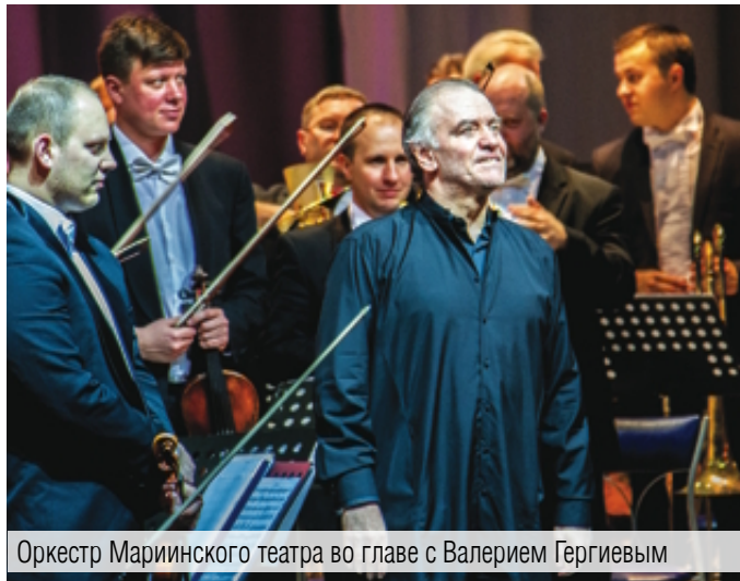
Оркестр Мариинского театра во главе с Валерием Гергиевым

Такого наплыва представителей высокого искусства наш город не припомнит