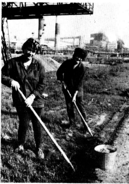
Фото и текст Ю. Кириллова.

На снимках: за работой коллектив ЦБУ СПЗ №2.