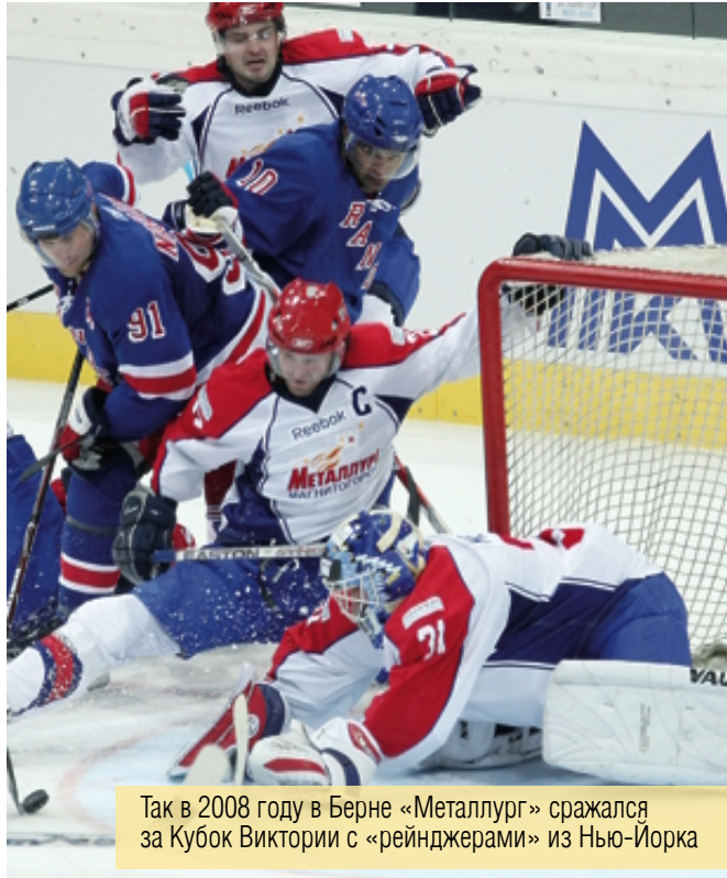
Так в 2008 году в Берне «Металлург» сражался за Кубок Виктории с «рейнджерами» из Нью-Йорка

Хоккеисты «Металлурга» – частые гости в Швейцарии