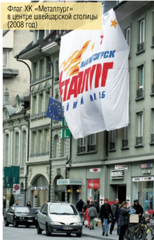
Флаг ХК «Металлург» в центре швейцарской столицы (2008 год)