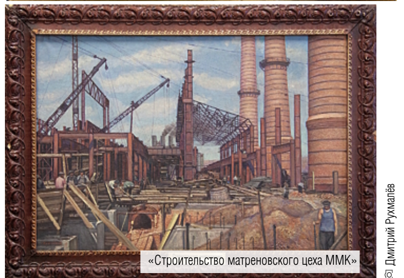
«Строительство матреновского цеха ММК»