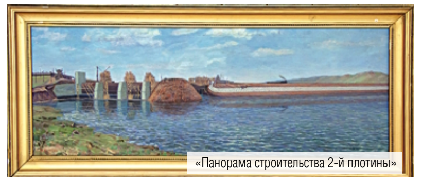
«Панорама строительства 2-й плотины»