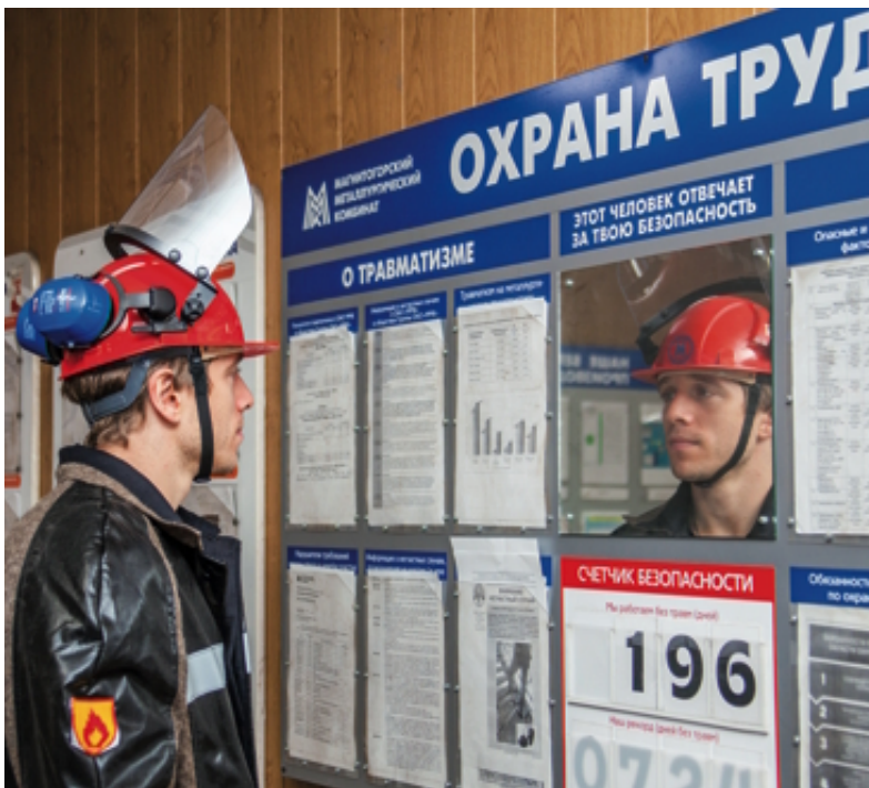
День первый - ККЦ