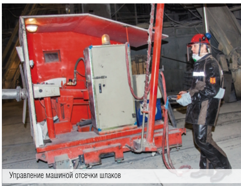
Управление машиной отсечки шлаков

Раскалённую «таблетку» металла – это и есть проба – сдают в