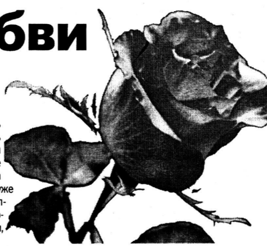
Под этими словами подпишет каждый читатель – металлург и мужчина.

И я смею возблагодарить коллег по труду за то, что вы просто есть. Что с вами хорошо. Что вы даете возможность расти, совершенствоваться, проявлять себя при вас и ради вас только достойно. И исключительно достойно.