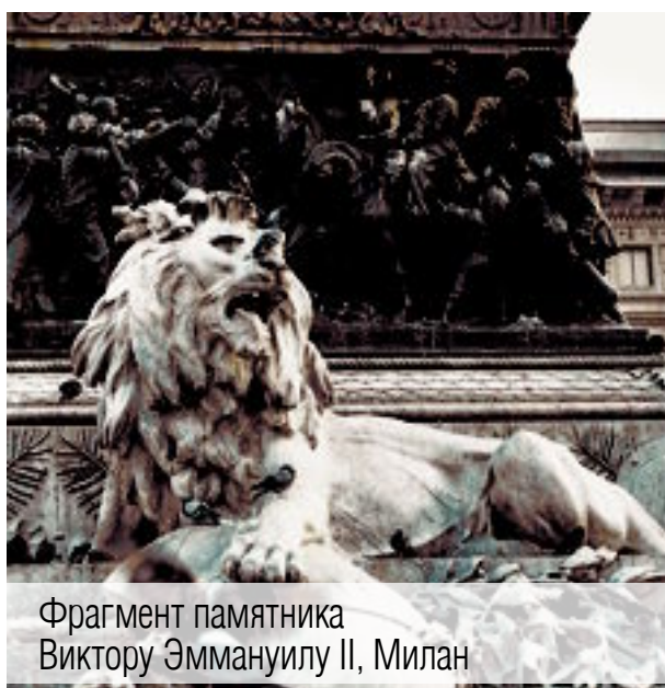
Фрагмент памятника Виктору Эммануилу II, Милан