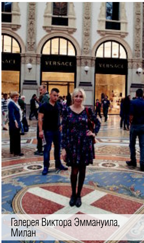
Галерея Виктора Эммануила, Милан