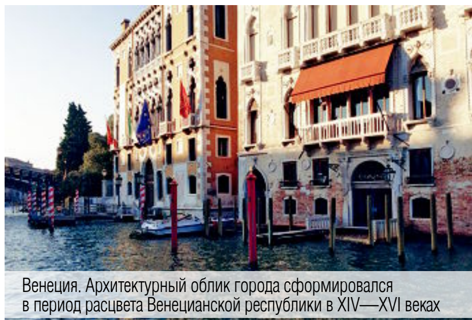
Венеция. Архитектурный облик города сформировался в период расцвета Венецианской республики в XIV—XVI веках