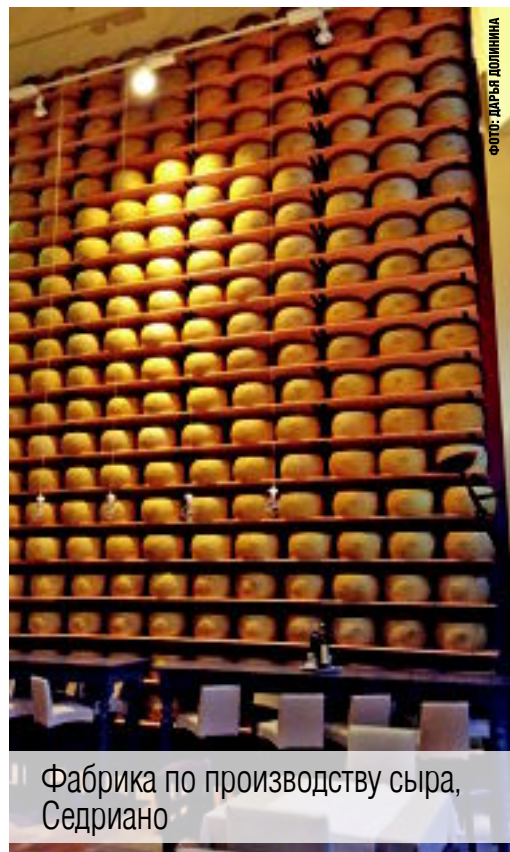
Фабрика по производству сыра, Седриано