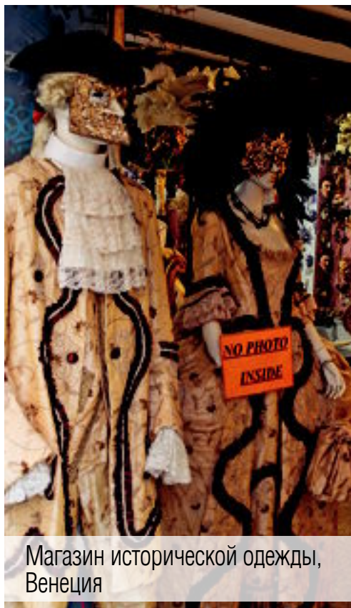
Магазин исторической одежды, Венеция

Так что, выезжая в Италию, берите с собой полупустой чемодан, потому что без покупок вряд ли уедете ☺