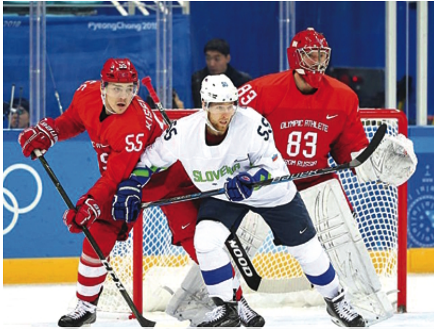
Василий Кошечкин (№ 83) – первый вратарь страны

В ближайшие дни на Олимпиаде разыграют медали в «наших» видах спорта