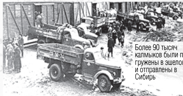
Более 90 тысяч калмыков были погружены в эшелоны и отправлены в Сибирь