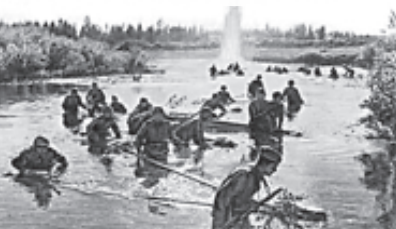
Начало битвы за Днепр