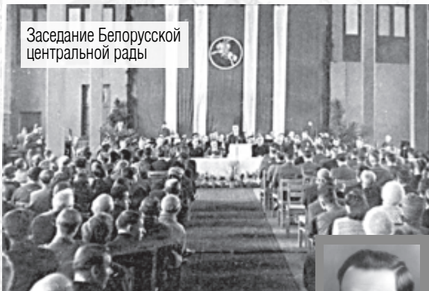
Заседание Белорусской центральной рады

Билет на танцы, на котором написано: «Все вырученные средства пойдут в помощь лабораторному фонду Сталинградского госпиталя»