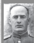
Константин Николаевич Леселидзе (1903–1944)