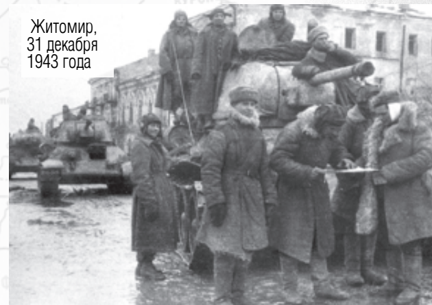
Житомир, 31 декабря 1943 года