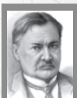
Композитор Александр Глазунов

вились на концерт. В большом зале в исполнении симфонического оркестра и хора фронтового ансамбля красноармейской песни и пляски впервые в Ленинграде прозвучала «Торжественная кантата» А. К. Глазунова, прославляющая величие русского народа.