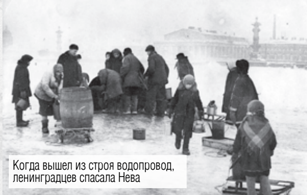
Когда вышел из строя водопровод, ленинградцев спасала Нева