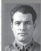
Иван Данилович Черняховский (1907–1945)