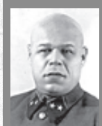
Павел Семенович Рыбалко (1894–1948)