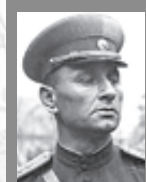
Андрей Антонович Гречко (1903–1976)