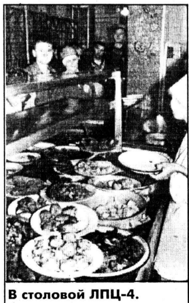
В столовой ЛПЦ-4.

— Очень вкусно, — ответила бригада рабочих, сидевших за одним из столов. — Сами мы из пятого листопрокатного. Но сегодня в нашей столовой санитарный день, поэтому пришли сюда. Да и многие из пятого предпочитают только эту столовую.