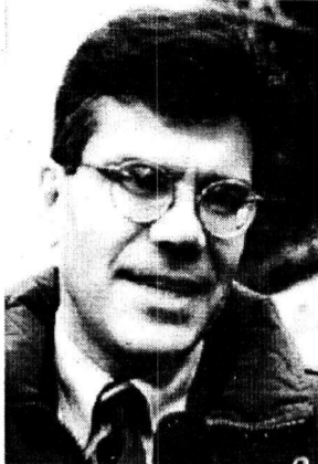
Генеральный консул США Дэниэл А. РАССЕЛ:

Три дня назад в нашем городе побывал Генеральный консул США Дэниэл А. Рассел. Цель визита — знакомство с легендарной Магниткой и ММК.