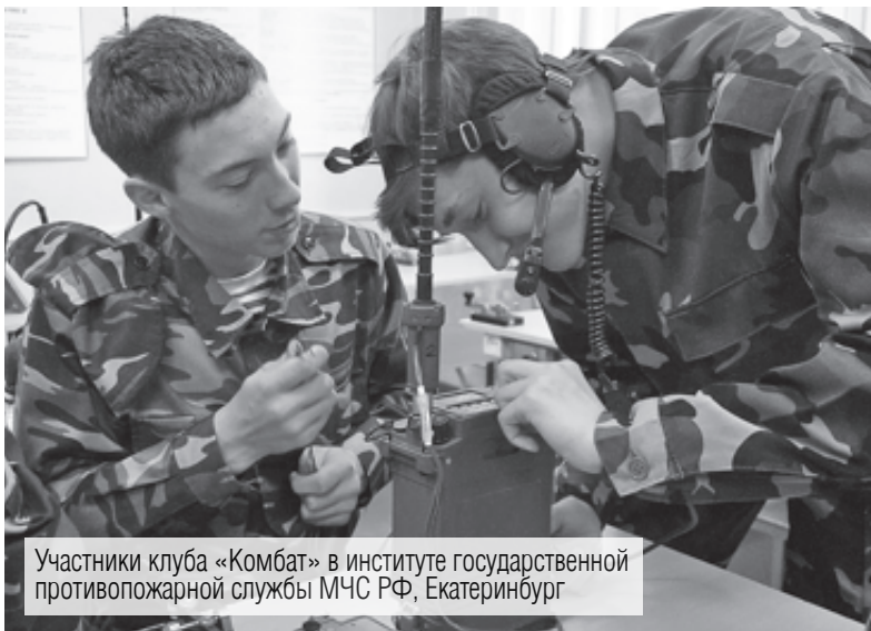
Участники клуба «Комбат» в институте государственной противопожарной службы МЧС РФ, Екатеринбург

В академическом лицее состоялась конференция «Перспективные направления в развитии социально-экономического профиля на основе сетевого взаимодействия с вузами МВД, МЧС, МО РФ».