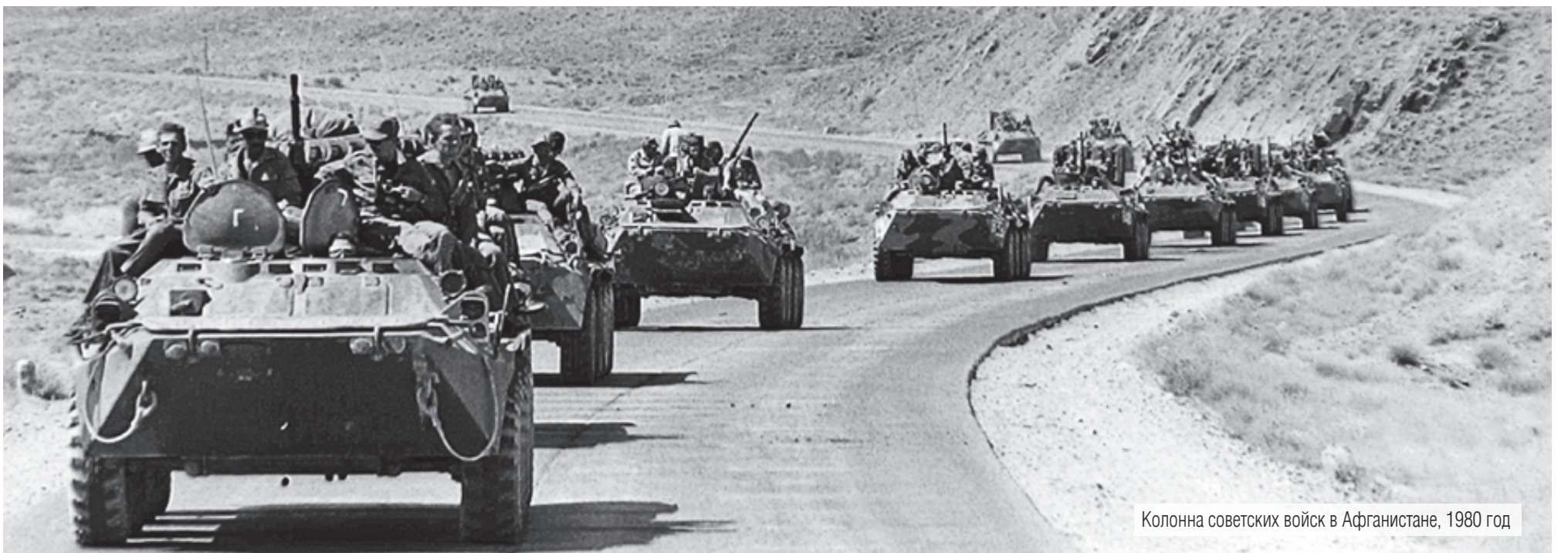
Колонна советских войск в Афганистане, 1980 год