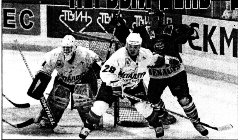
Магнитка держит оборону...