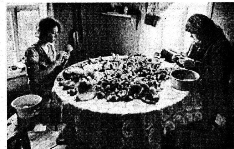
Страницу подготовила Римма ДЫШАЛЕНКОВА.