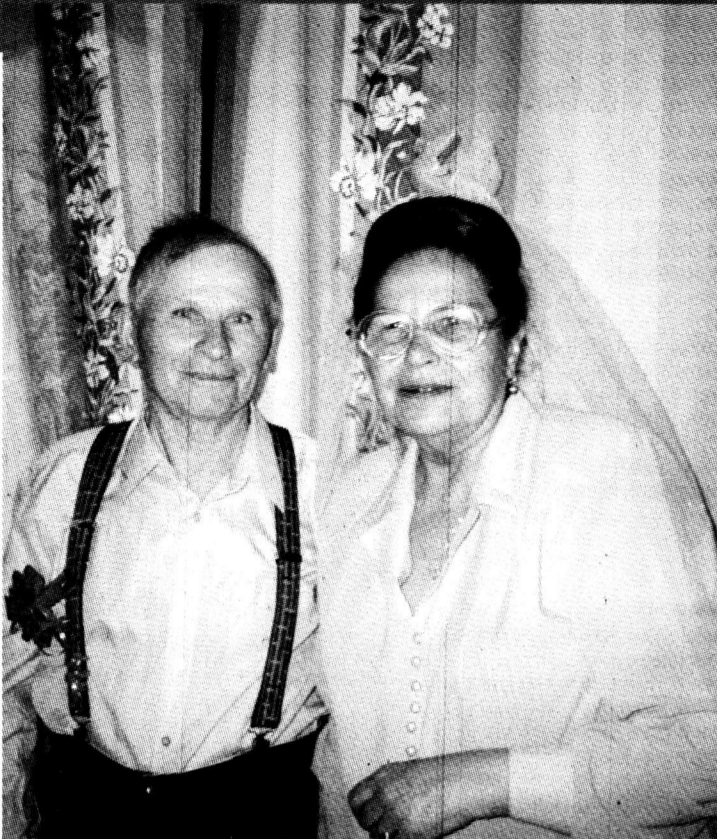
Р. С. В день свадьбы моих бабушку и дедушку приглашали на стадион и поздравляли. Это совпало с Днем города и пригласи-

«Главное – терпение и взаимопонимание, умение слушать и особенно слышать любимого чело-