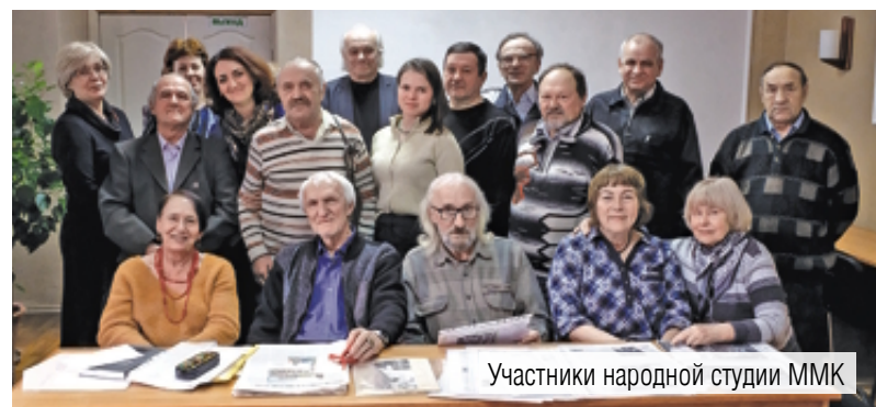
Участники народной студии ММК