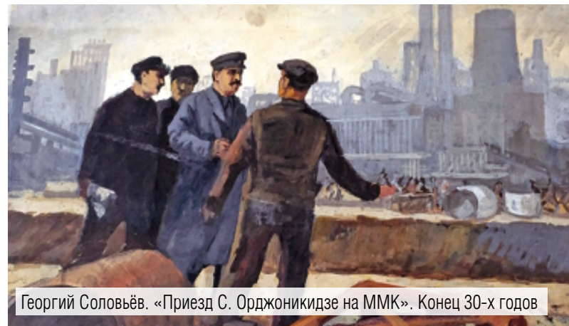
Георгий Соловьёв. «Приезд С. Орджоникидзе на ММК». Конец 30-х годов