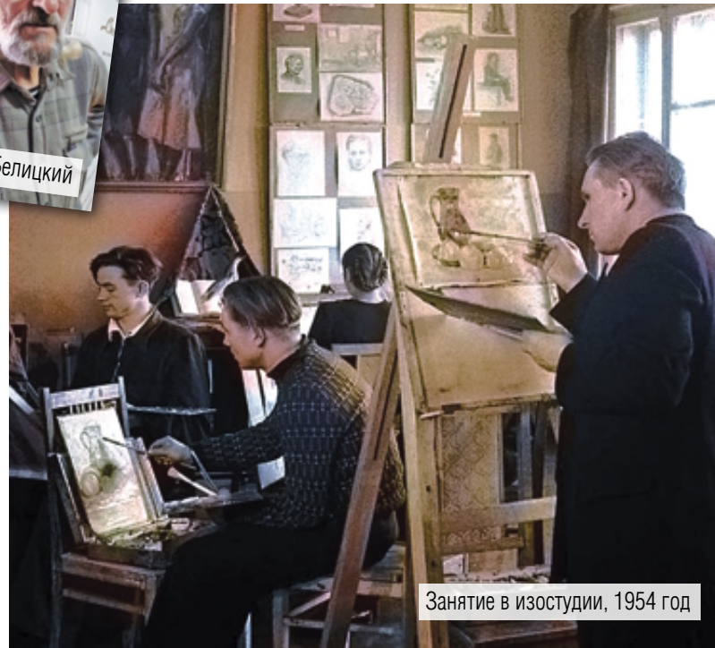
Занятие в изостудии, 1954 год