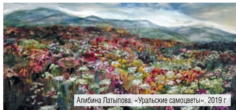
Алибина Латыпова. «Уральские самоцветы». 2019 г

общественному заказу. Но делал это искренне, честно».