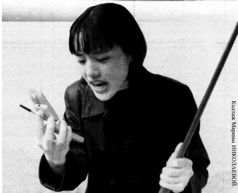
Коллаж Марина НИКОЛАЕВОЙ