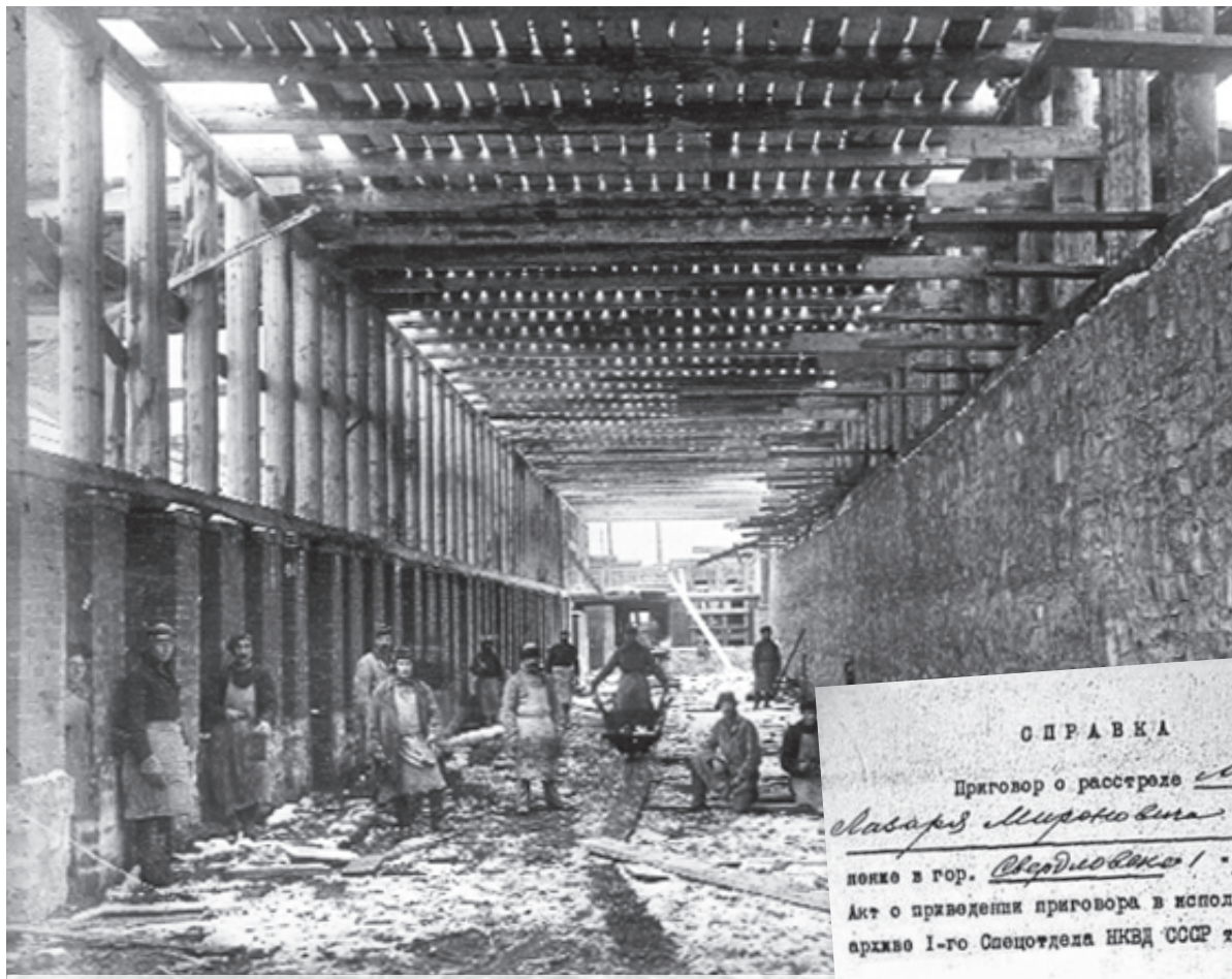
Строительство коксовой печи

Историю во все времена творили личности, и Магнитка, начиная с первых дней существования, являла яркий тому пример