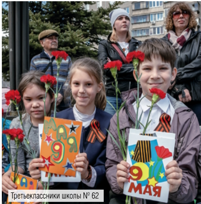
Третьеклассники школы № 62