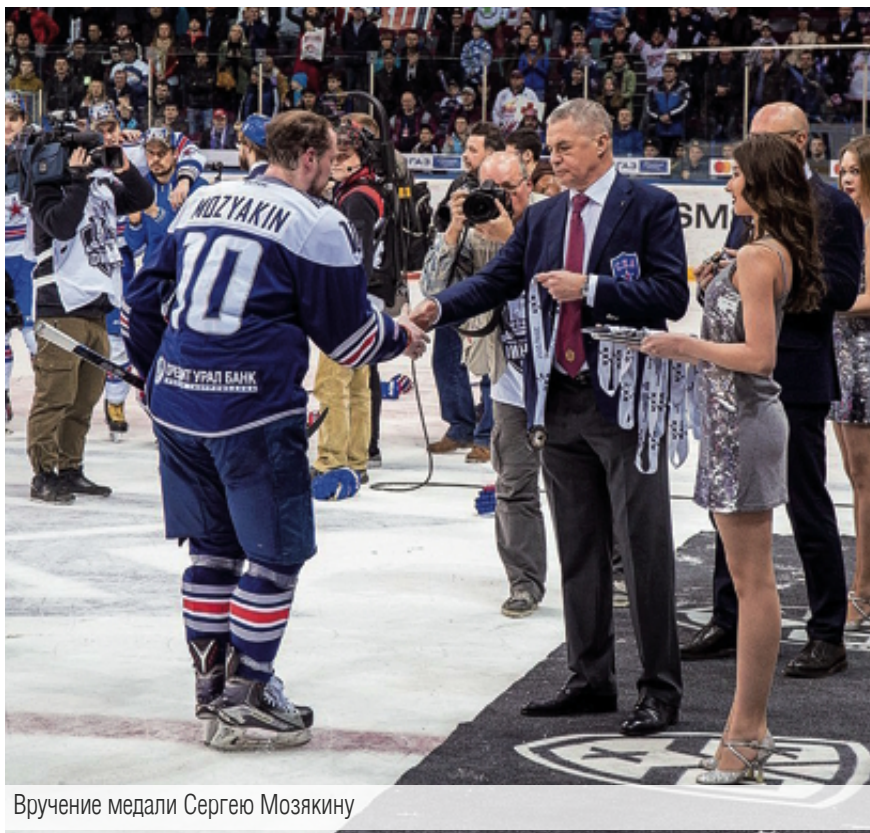
Вручение медали Сергею Мозякину